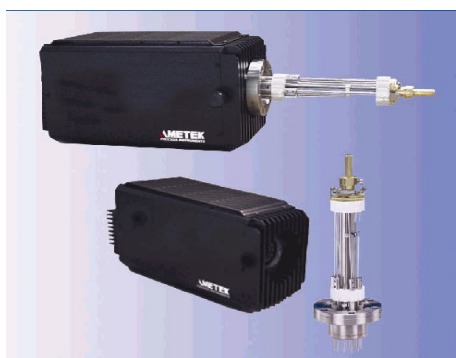
Взаимозаменяемые блоки детектора