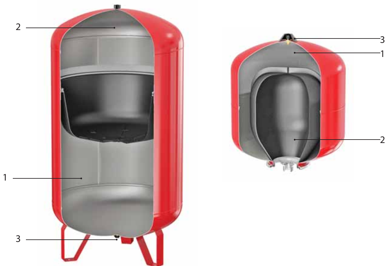
Рис. 1 Мембранные расширительные баки «Гранлевел»

Теплоносителем может служить этиленгликолевая смесь с концентрацией не более 50 %.